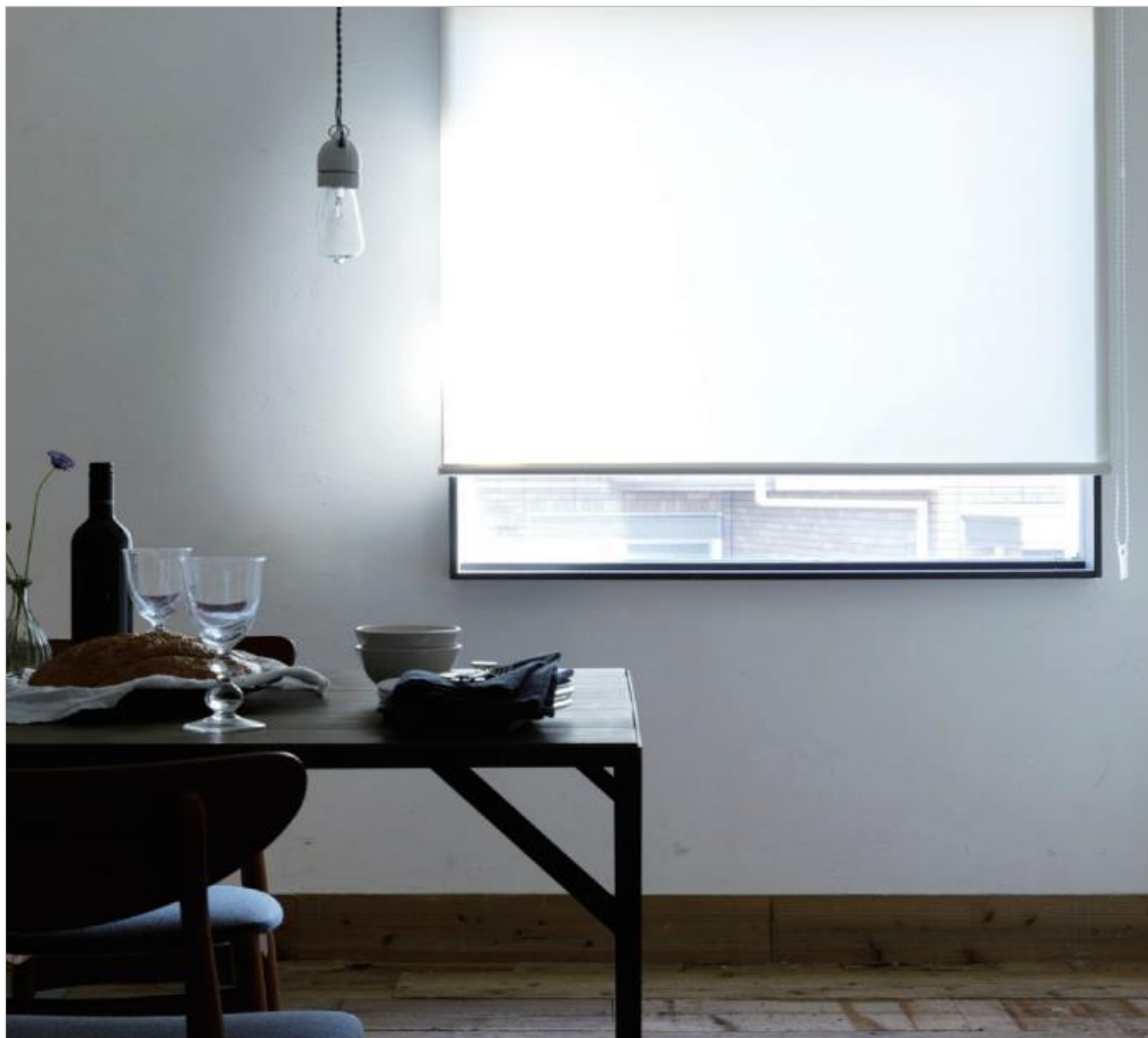
■ロールスクリーン：生地コルト