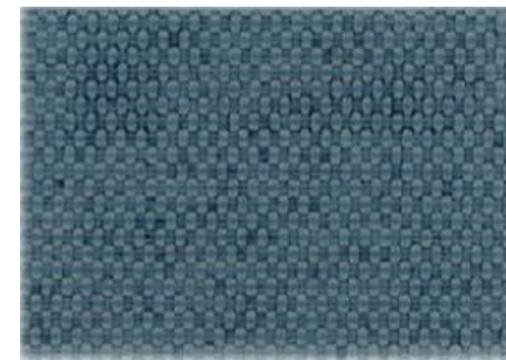
TR4480 ターコイズブルー